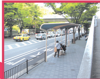
阪急バス(10番) のりば後方